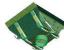
Sortie Ronde Ø 285mm Round outlet